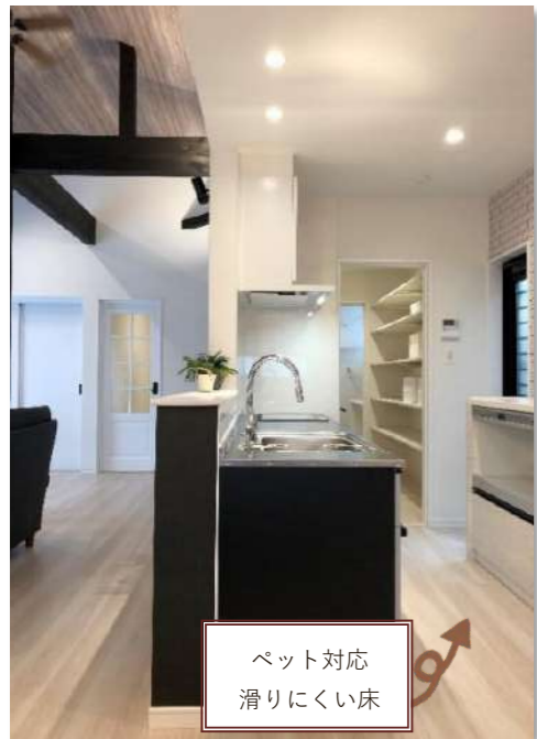
ペット対応 滑りにくい床

【洗面洗濯室】 室内干しができ、洗う→干す→たたむが楽に出来るスペース。 パントリー、キッチンへもスムーズに移動できる家事楽な動線です。 白で統一されているため、清潔感◎